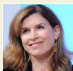
Trisha Thomas Associated Press