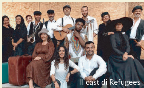
Il cast di Refugees