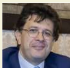
Gaspare Borsellino Italtpress