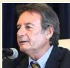
Felice Cavallaro Corriere della Sera