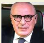
Xavier Jacobelli Tuttosport