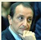
Riccardo Arena Giornale di Sicilia

Il Premio è suddiviso in quattro sezioni: Stampa estera; Stampa nazionale, sezione carta stampata, testate online e agenzie di stampa; Stampa nazionale, sezione tv e radio; Giornalista emergente (under 30).